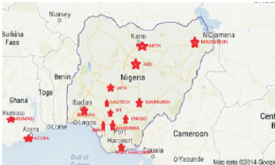
Fig. 1: GPS adapted map from Google showing locations of the respondents in West Africa